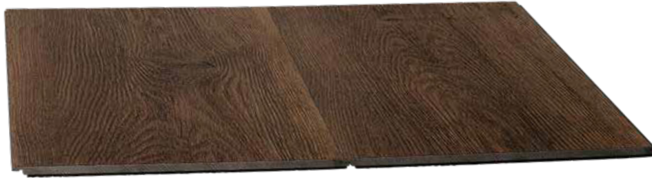
SAGIFLOOR 1220 x 183 x 6 mm