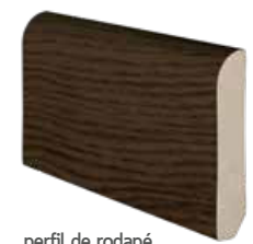
perfil de rodapé baseboard profile profilé de plinthe 2400 x 60 x 12 mm