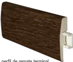
perfil de remate terminal end trim profile profilé terminal de finition 2400 x 45 mm