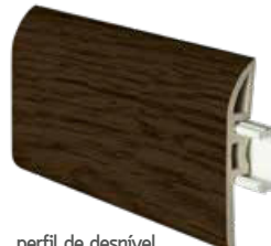
perfil de desnível gap profile profilé d'ecart 2400 x 45 mm