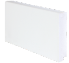
perfil de rodapé branco 70 x 14 white baseboard profile 70 x 14 profilé de plinthe blanc 70 x 14 2200 x 70 x 14 mm