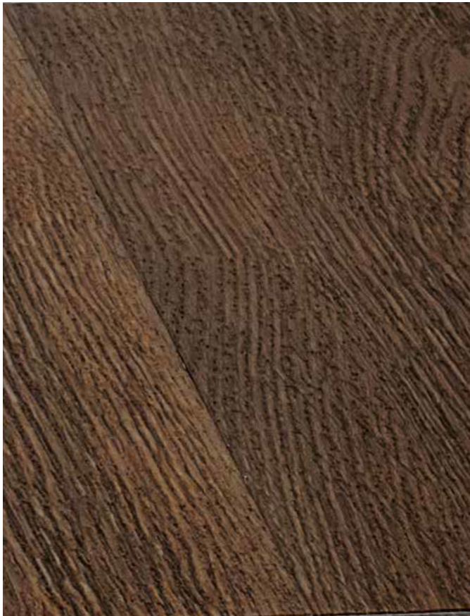
Poro Sincronizado [EIR] Synchronized Pore [EIR] Pore Synchronisé [EIR]