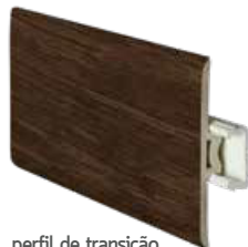
perfil de transição transition profile profilé de transition 2400 x 45 mm