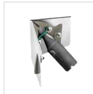
Espátula para cantos