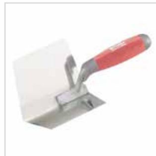
Espátula de ângulo interior