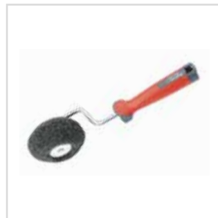
Rolo p/ massa cantos Roll Enduit