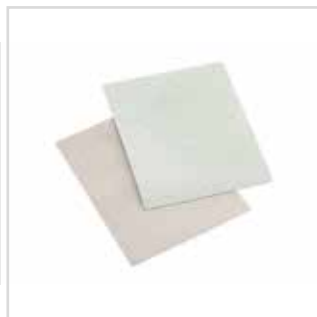
Lixa para lixadora cantos

120 | 5396120 180 | 5396180 220 | 5396220