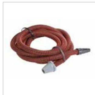
Mangueira aspiração universal p/ lixadora