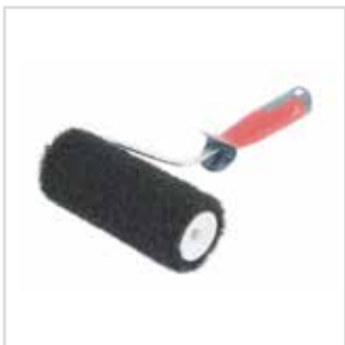
Rolo p/ massa Roll Enduit

80 mm | 2987080 80 mm | 987080 (carga) 180 mm | 2987180 180 mm | 987180 (carga)