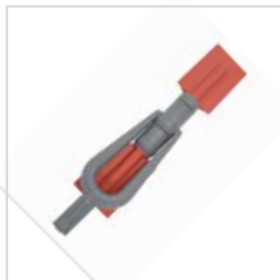
Lixadora para cantos