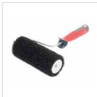
Rolo p/ massa Roll Enduit

2 x 0,50 m | 3541050 2 x 1 m | 3541100 2 x 2 m | 3541200