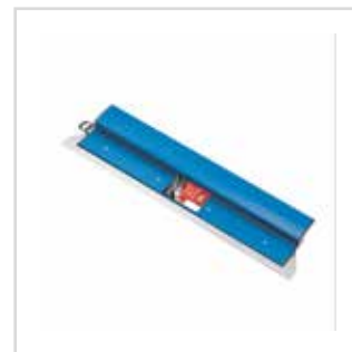
Lâmina para barramento Parfait Liss