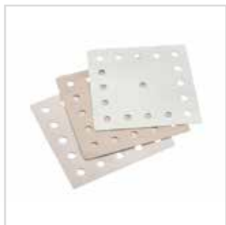
Lixa para lixadora

120 | 5396120 180 | 5396180 220 | 5396220