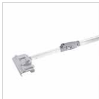
Cabo extensor para espátulas Déco Liss

2 x 0,70 m | 1482070 2 x 1 m | 1482100 2 x 1,5 m | 1482150