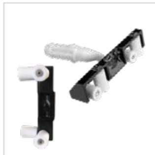
Rolo para cantos