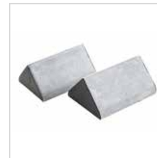
Esponja para lixadora Ergo LISS