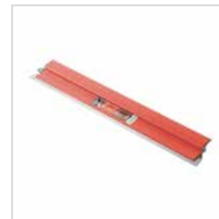
Lâmina para alisamento Parfait Liss

10 cm | 541010 25 cm | 541025 35 cm | 541035 45 cm | 541045 60 cm | 541060 80 cm | 541080 100 cm | 541100 120 cm | 541120