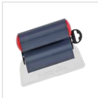
Lâminas Déco Liss

80 mm | 2987080 80 mm | 987080 (carga) 180 mm | 2987180 180 mm | 987180 (carga)