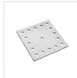
Esponja para lixadora Ergo LISS