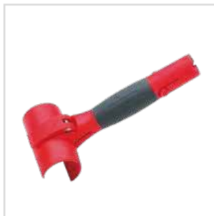
Punho/pega Déco Liss