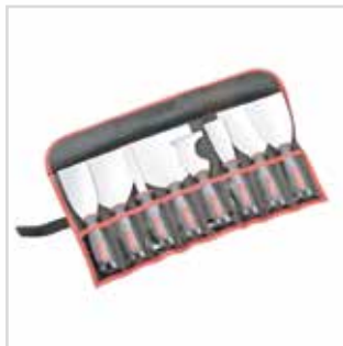
Kit espátulas plaquista