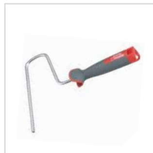
Pega para rolo Roll Enduit

80 mm | 2987080 80 mm | 987080 (carga) 220 mm | 2987220 220 mm | 987220 (carga)