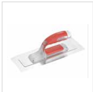
Taloça inox acabamento lâmina dupla - Biflex

10 cm | 541010 25 cm | 541025 35 cm | 541035 45 cm | 541045 60 cm | 541060 80 cm | 541080 100 cm | 541100 120 cm | 541120