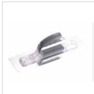
Taloça inox biflex - Soft Line

30 x 11 cm | 1725030 35 x 11 cm | 1725035 40 x 11 cm | 1725040 45 x 11 cm | 1725045