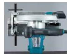
Carcasa de motor plana