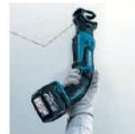
Gatillo en empuñadura.