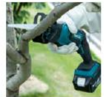
Gatillo en cuerpo.